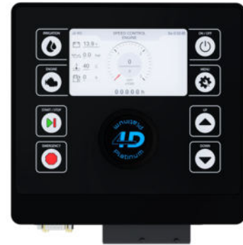
IRRIMOP IRRIMOP ID4 IRRIMOP ID4 PLATINUM